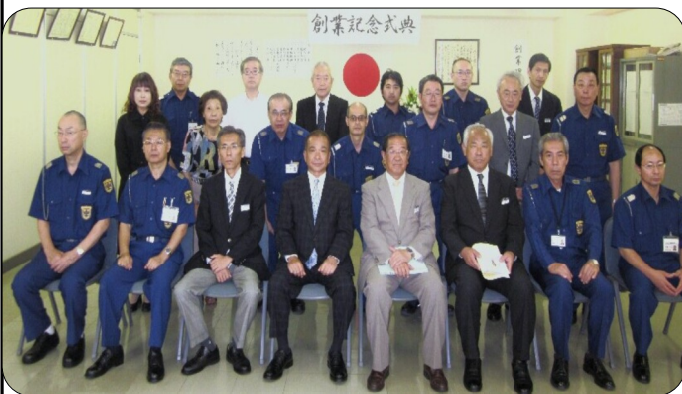
役員並びに受賞者の皆さんです。

今回の未曾有の大災害が発生したことを肝に銘じ、作品が出来上がったのではないのでしょうか。おめでとう御座いました。