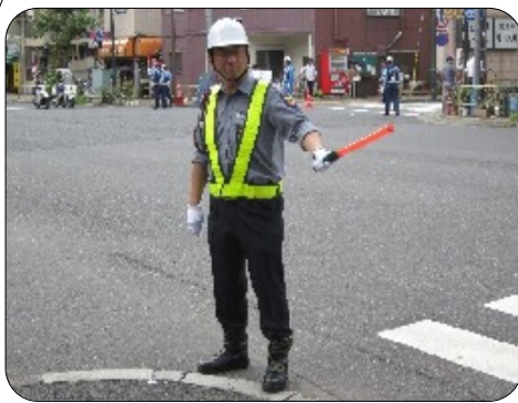
誘導中のGMC白根係長