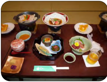
昼食は豪華な懐石料理