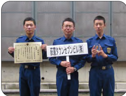
荻窪タウンセブンビル自衛消防隊の皆さん

全日本ガードシステムは、荻窪消防署主催の大会が九月二十五日に井草森公園にて開催されました。こちらの大会に、