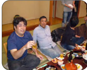
風呂上がりのビールはうまい!!